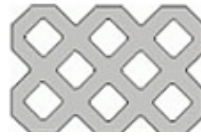
60 x 40 x 8 (10)