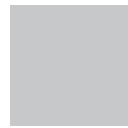
40 x 40 x 4